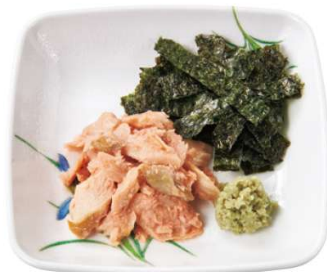
【汤汁泡饭用】 鲑鱼松小碗 ¥ 150