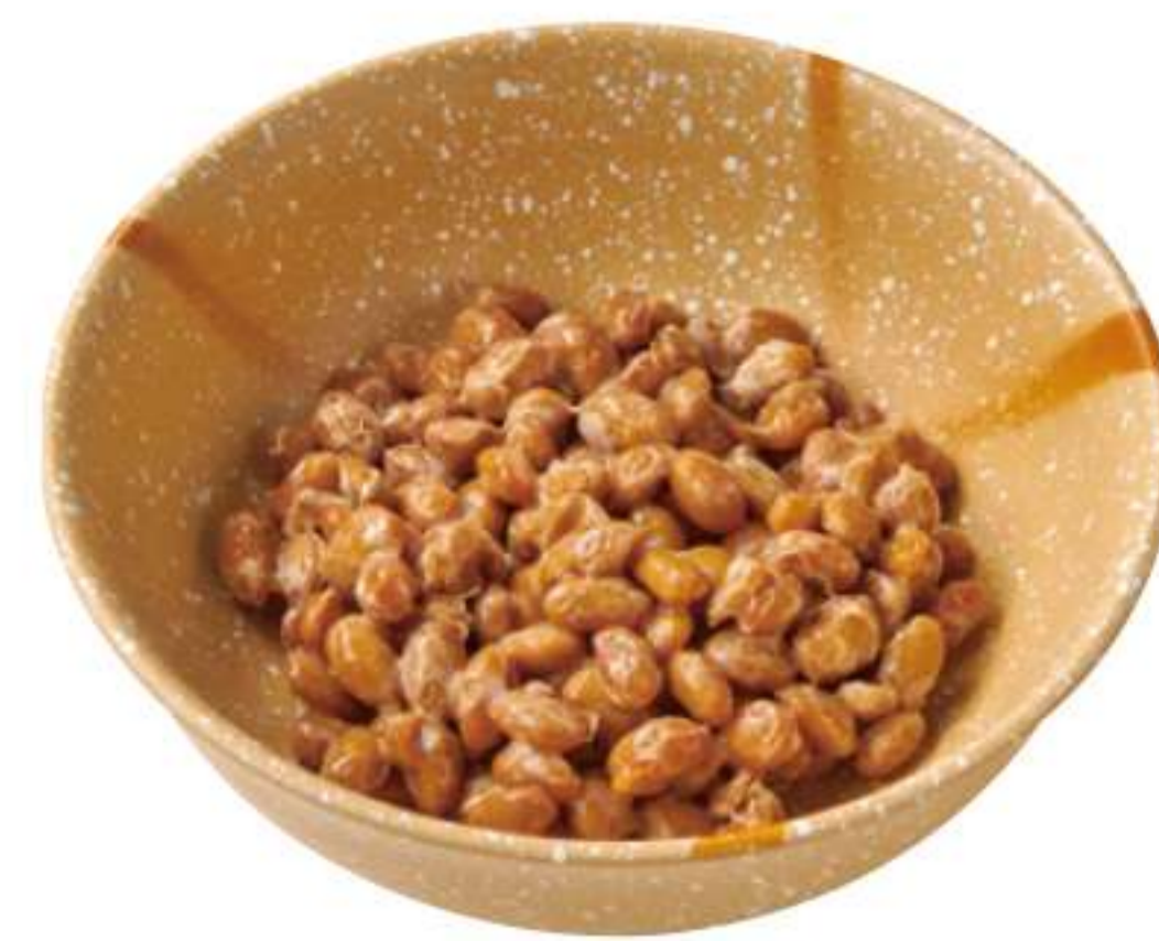
纳豆 ¥ 100