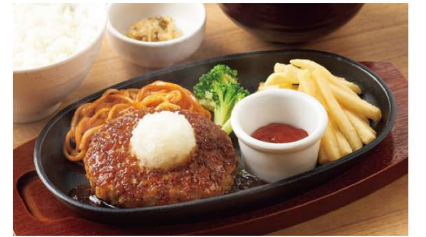
日式萝卜泥汉堡套餐