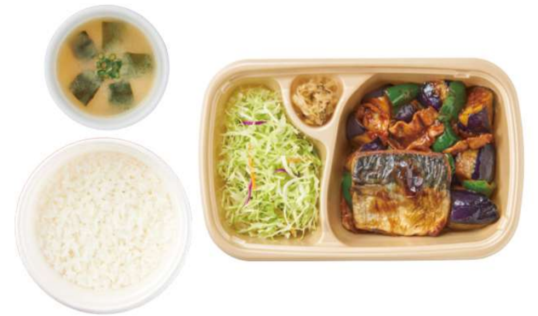
茄子猪肉豆酱和烤鱼 带米饭、酱汤 ¥ 1,020