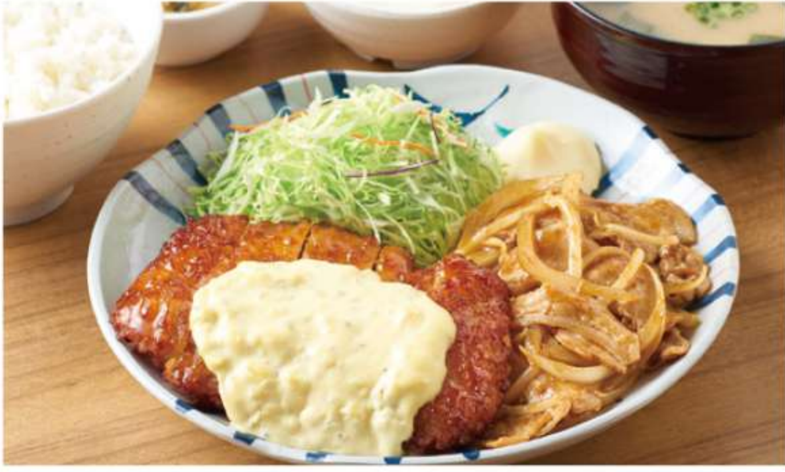
炸鸡排与姜汁烤肉人气2组合套餐