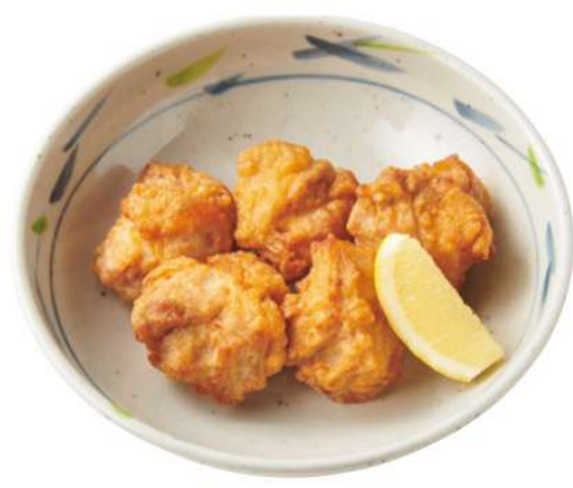
炸鸡块(5块) ¥ 520