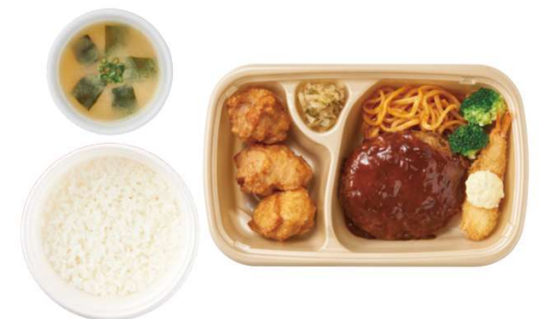
汉堡肉饼、油炸虾和炸鸡块人气3件套 带米饭、酱汤 ¥ 1,150