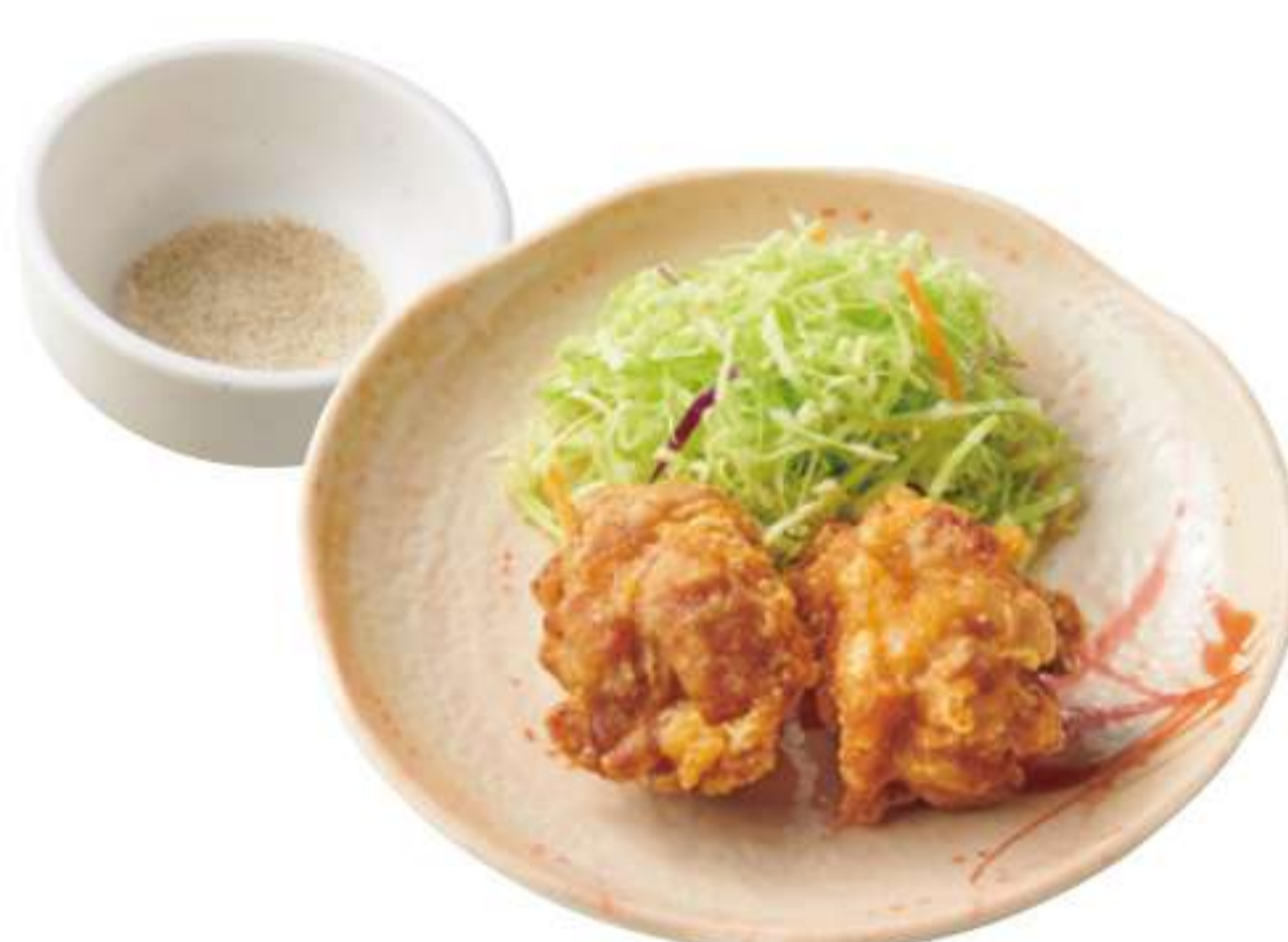
小口炸鸡块 ¥ 240