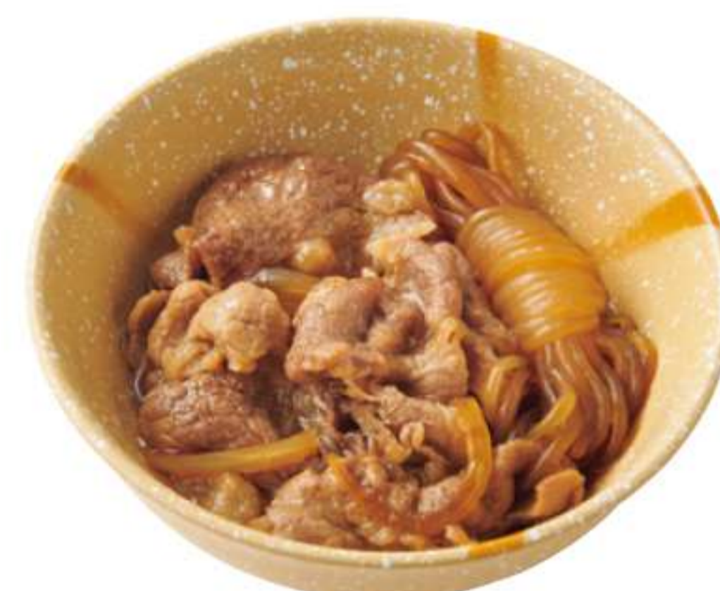
日式牛肉火锅小碗 ¥ 280