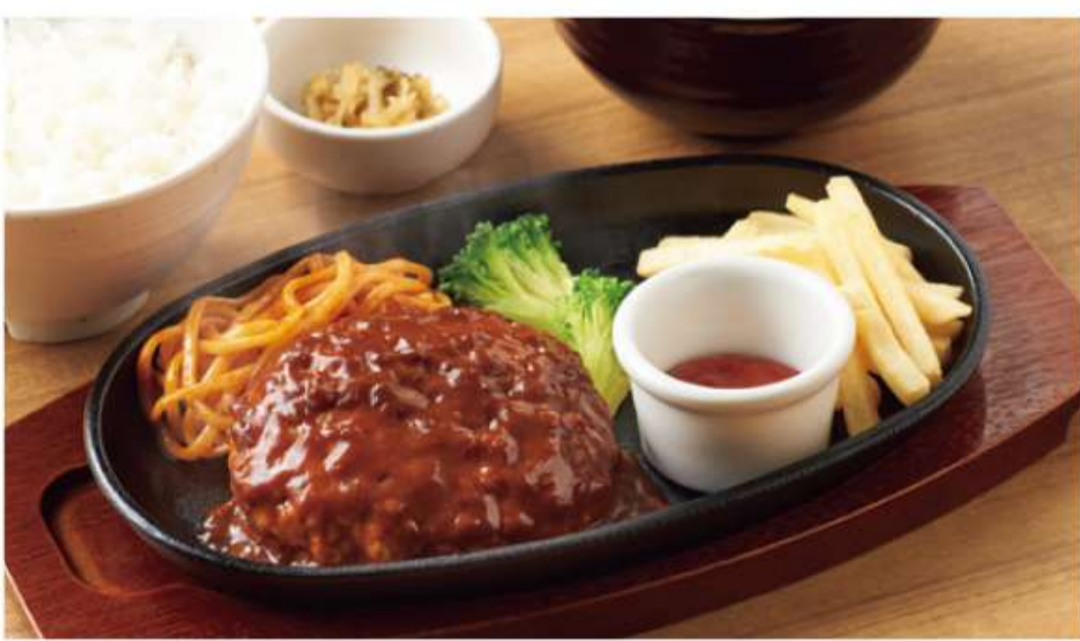
多蜜酱汁汉堡套餐