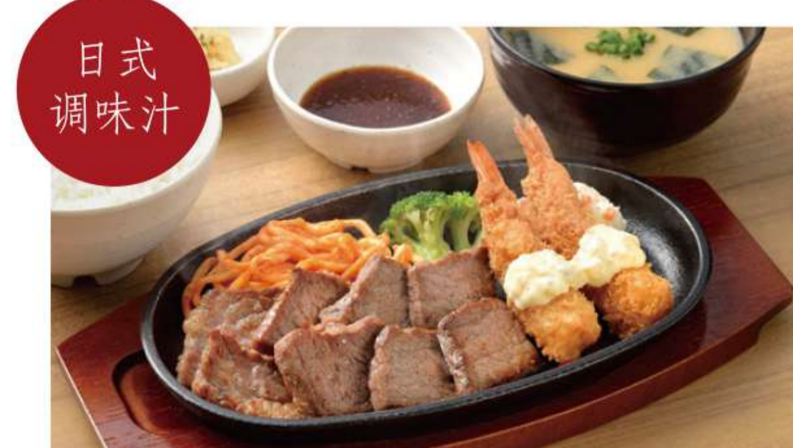
黑安格斯牛切块牛排和油炸虾套餐