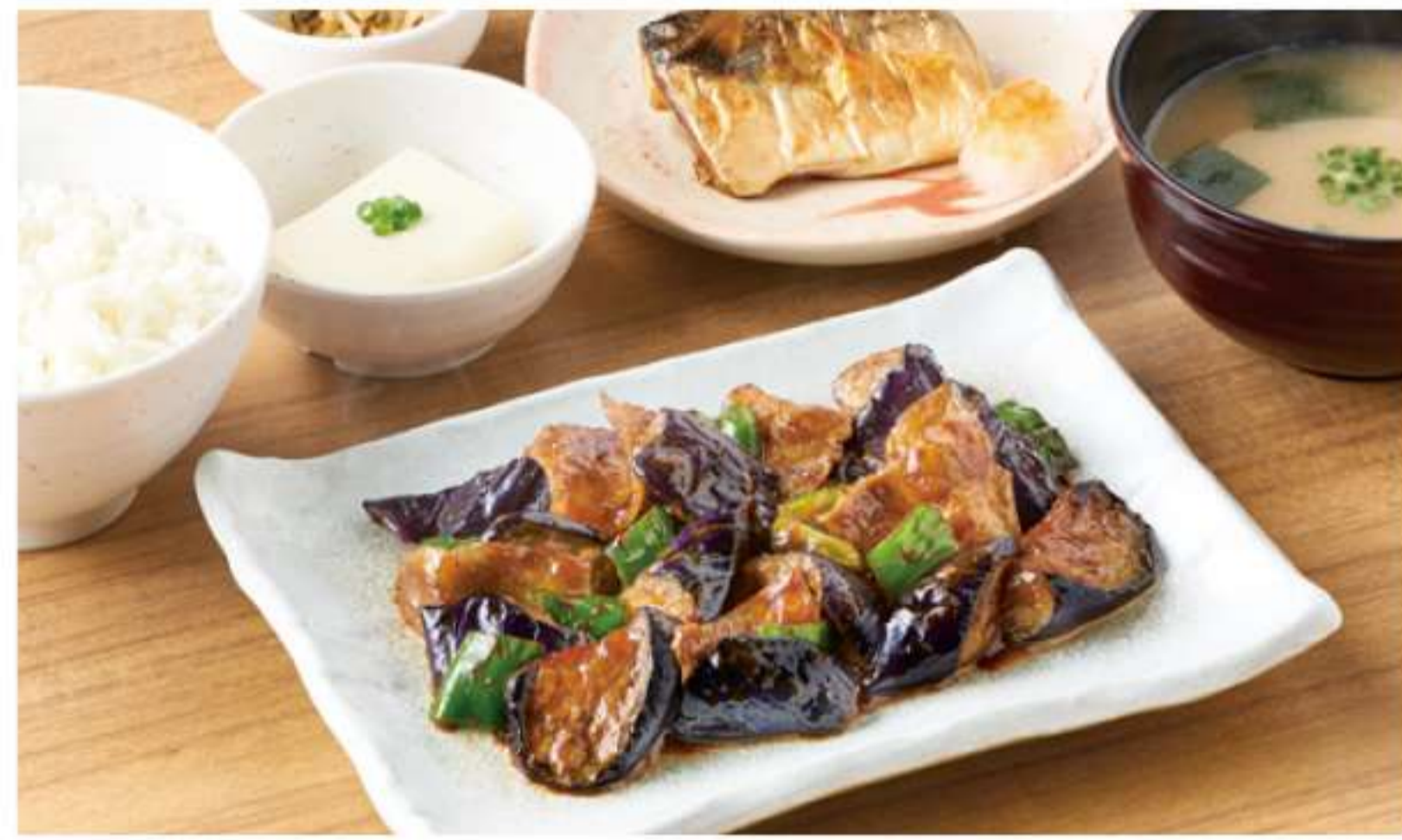
茄子猪肉豆酱和烤鱼肉套餐