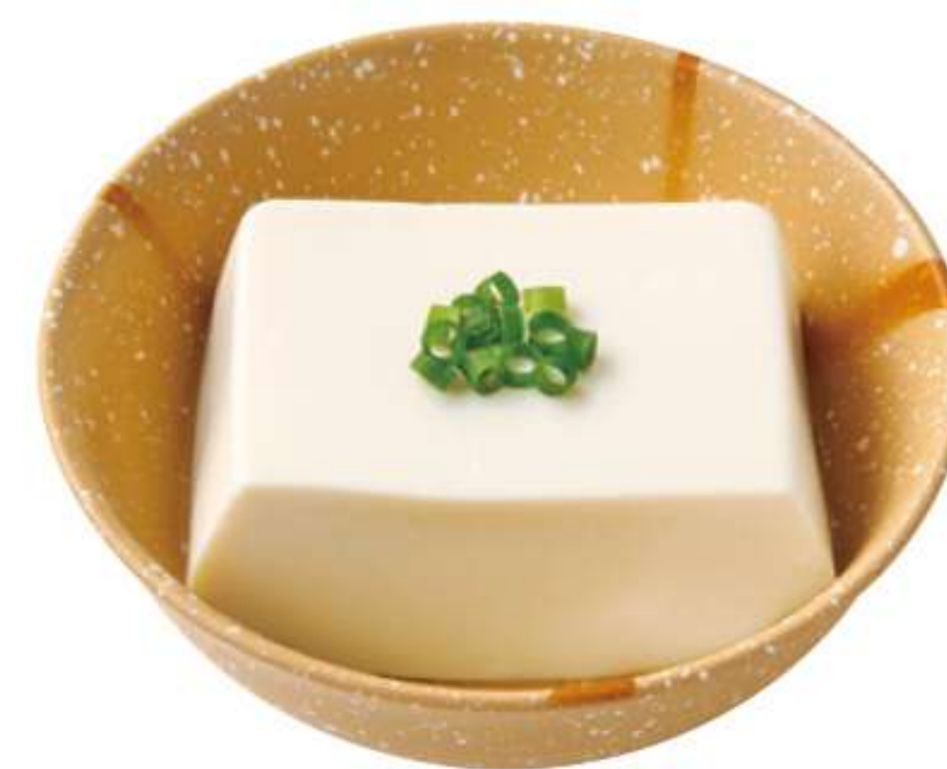
凉豆腐 ¥ 100