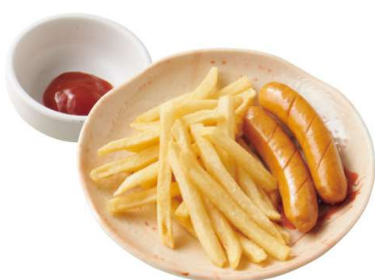
炸薯条和香肠 ¥ 250