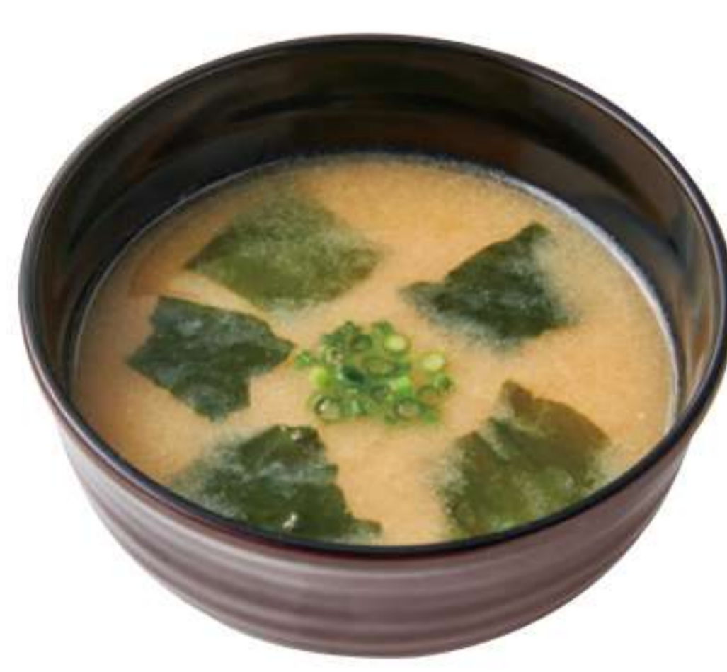
酱汤(单点) ¥ 100