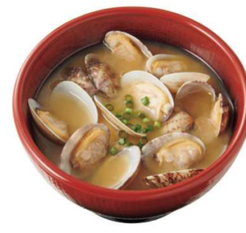
蛤蜊汤(单点) ¥ 290