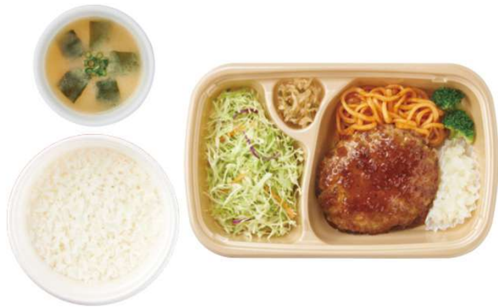
日式萝卜泥汉堡 带米饭、酱汤 ¥ 860