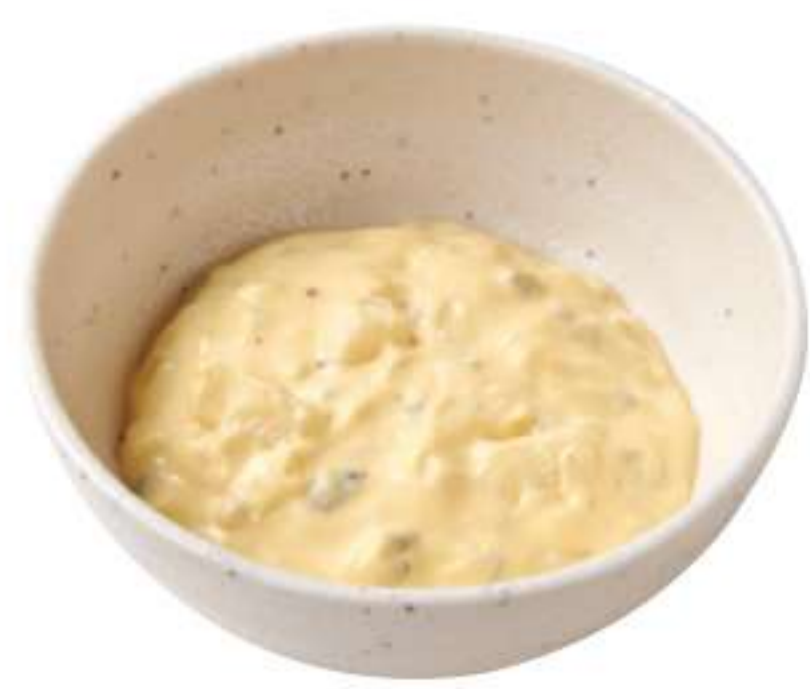
鞑靼沙司(单点) ¥ 50