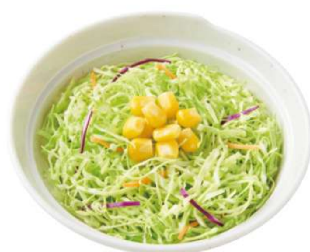
蔬菜色拉 ¥ 90