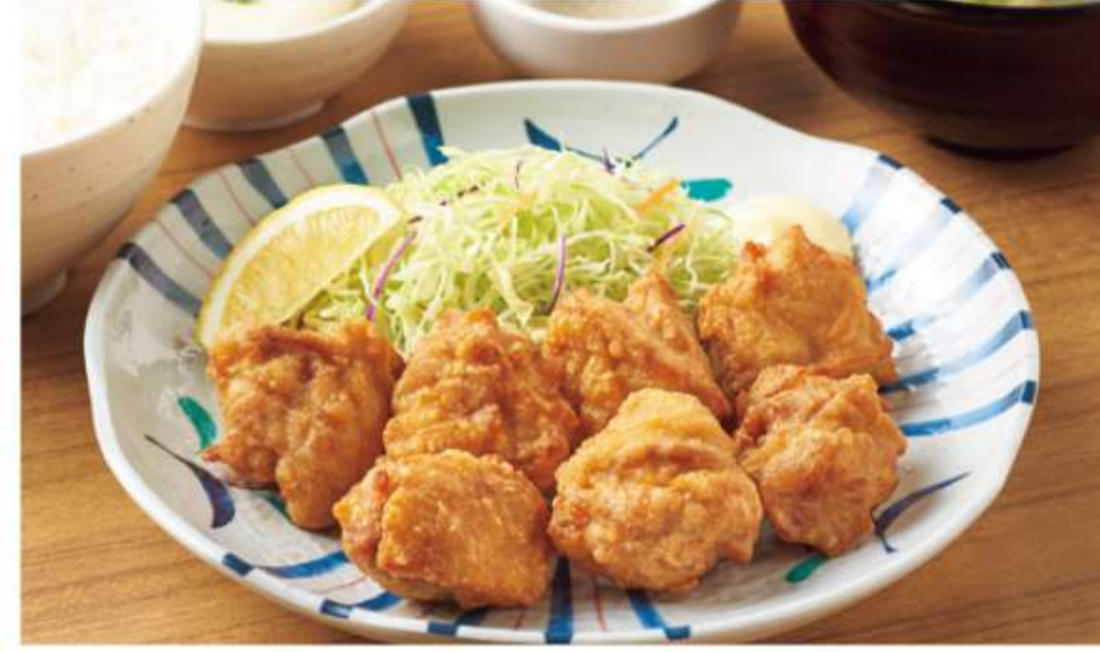
特大份炸鸡块套餐