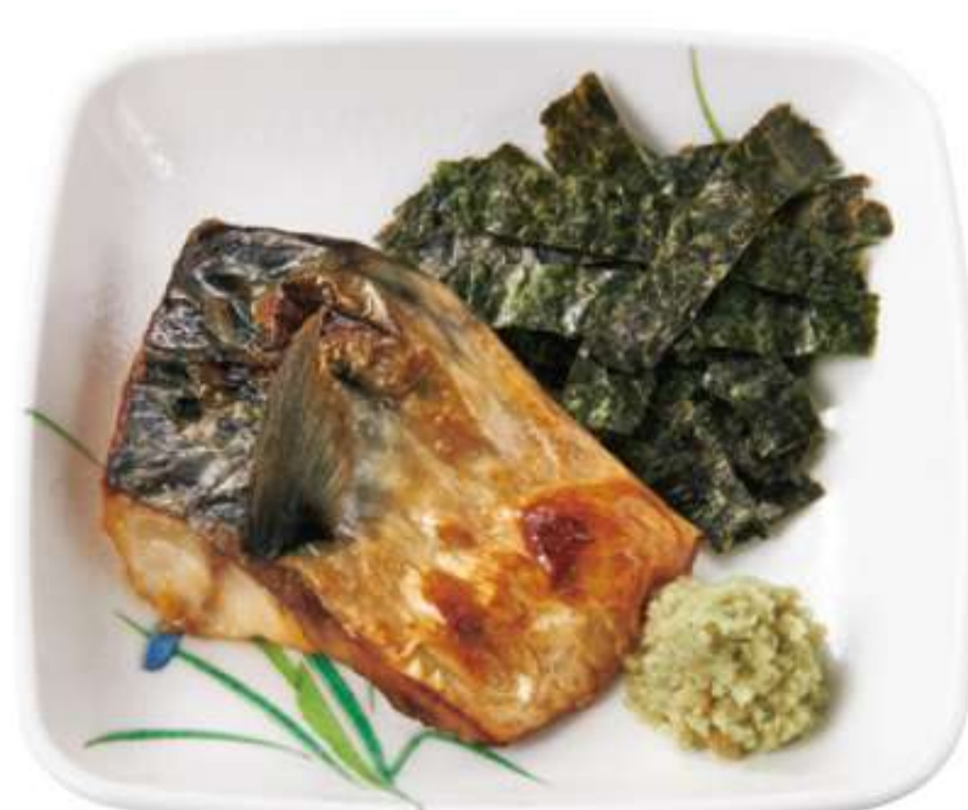
【汤汁泡饭用】 迷你青花鱼小碗 ¥ 150