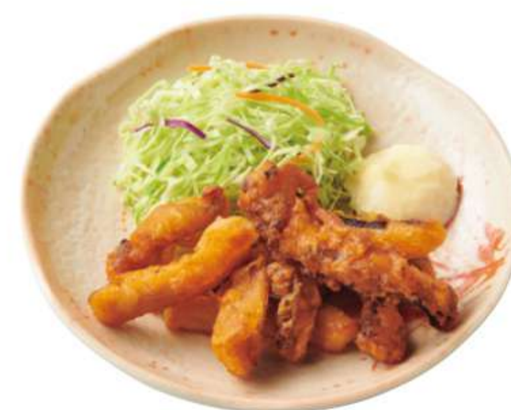
酥炸鱿鱼块 ¥ 220