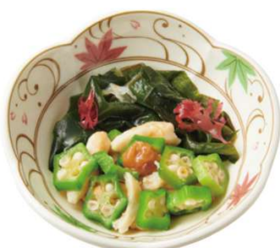
蒸鸡橙醋拌海藻小碗 ¥ 120