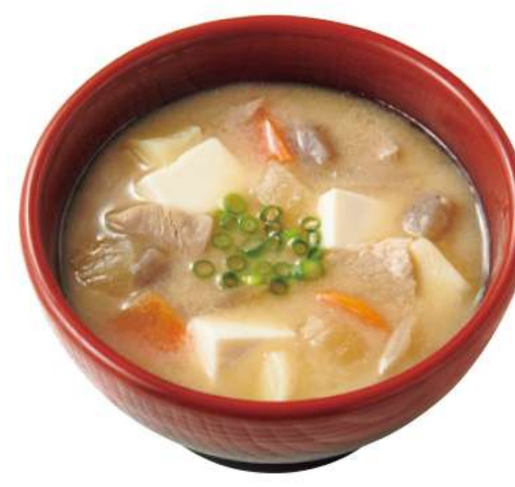
猪肉酱汤(单点) ¥ 290