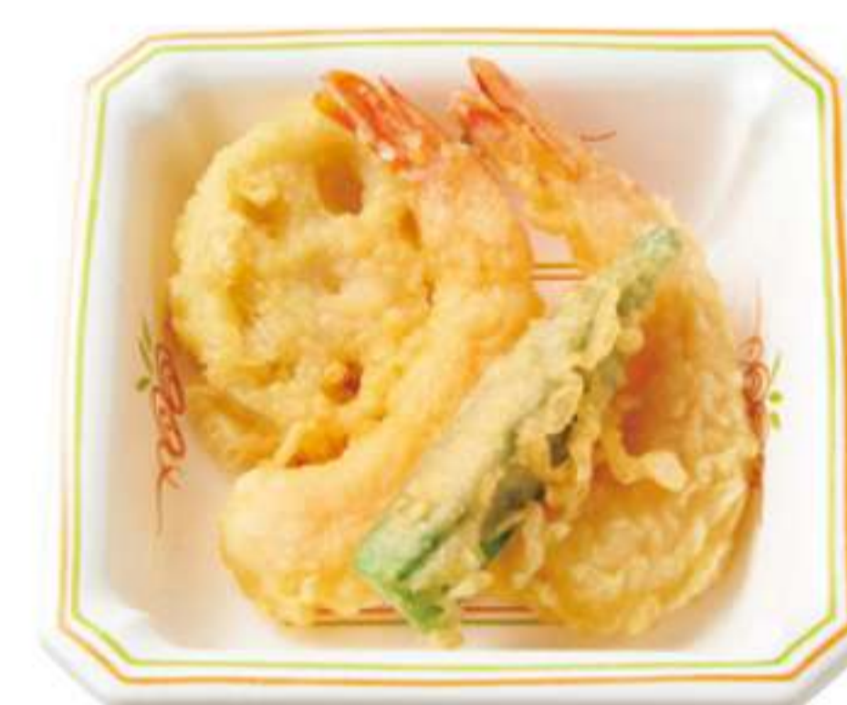
天妇罗小碗 ¥ 290