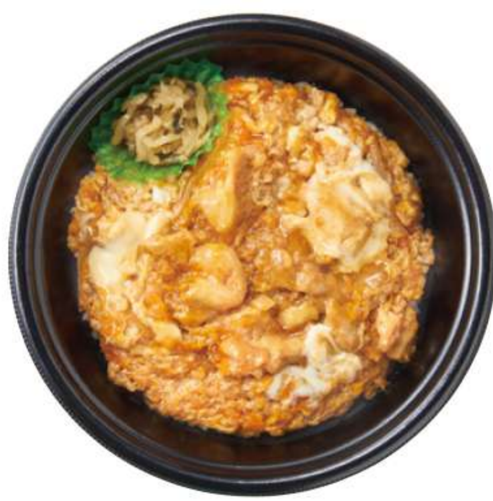
阿波尾鸡亲子盖饭