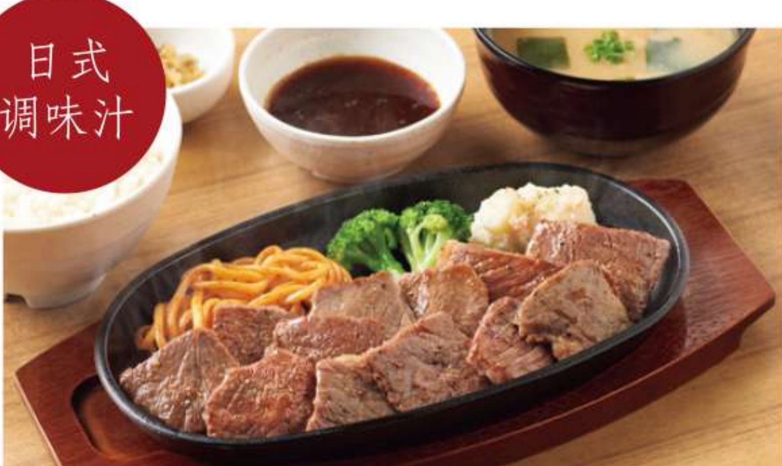
黑安格斯牛特大份切块牛排套餐