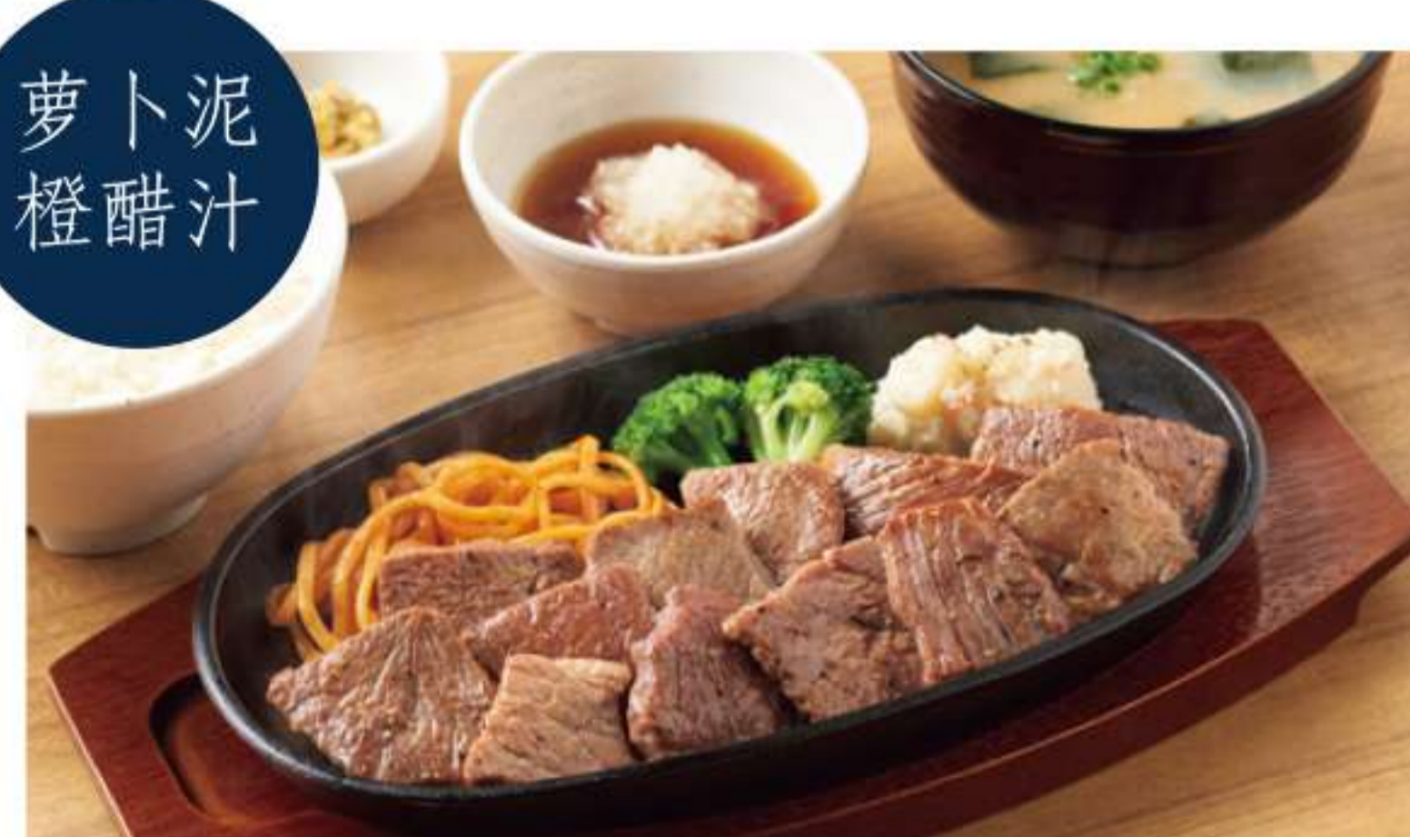
黑安格斯牛特大份切块牛排套餐