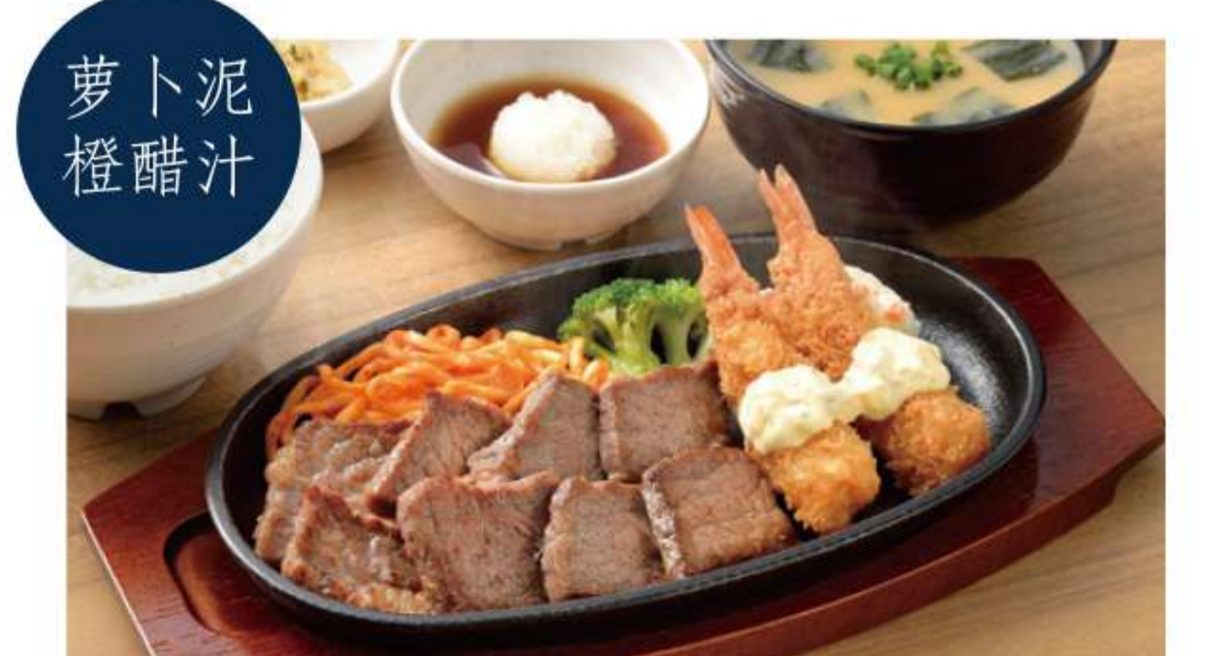
黑安格斯牛切块牛排和油炸虾套餐