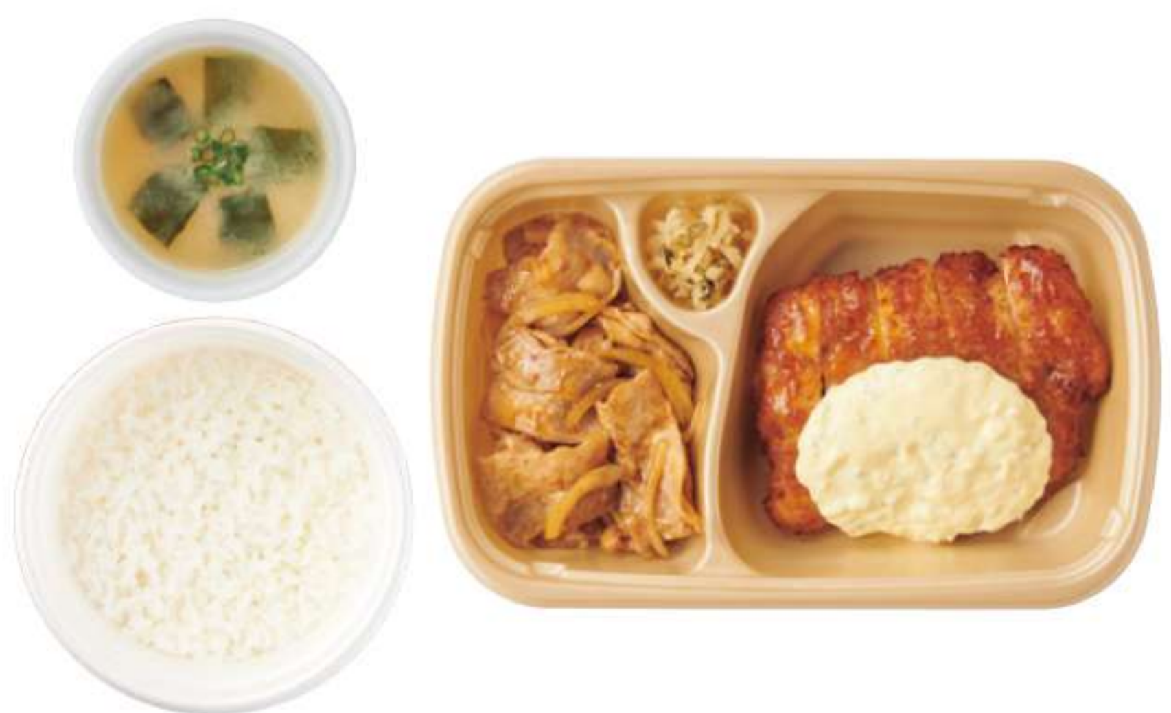
炸鸡排与姜汁烤肉人气2件套 带米饭、酱汤 ¥ 1,150