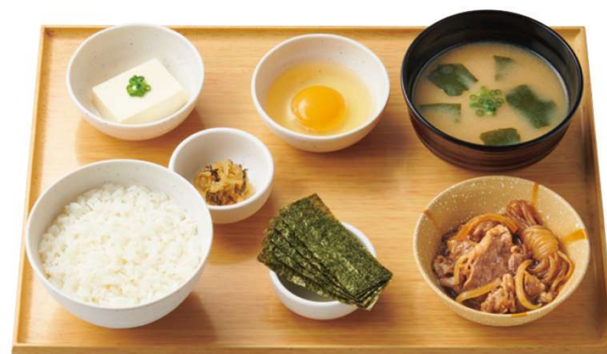
迷你日式牛肉火锅早餐

※24小时营业店铺的早餐销售时间为上午5点到上午11点。其他店铺的营业时间，请向各店铺咨询。