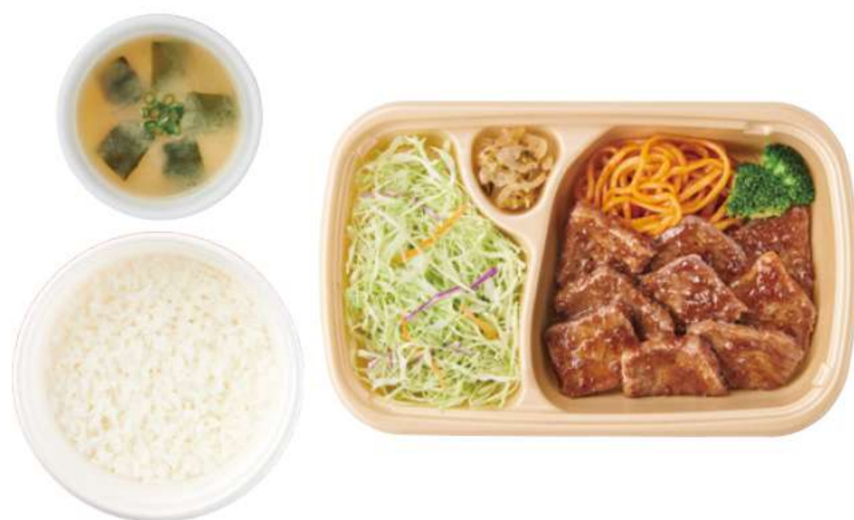
黑安格斯牛切块牛排 带米饭、酱汤 ¥ 1,340