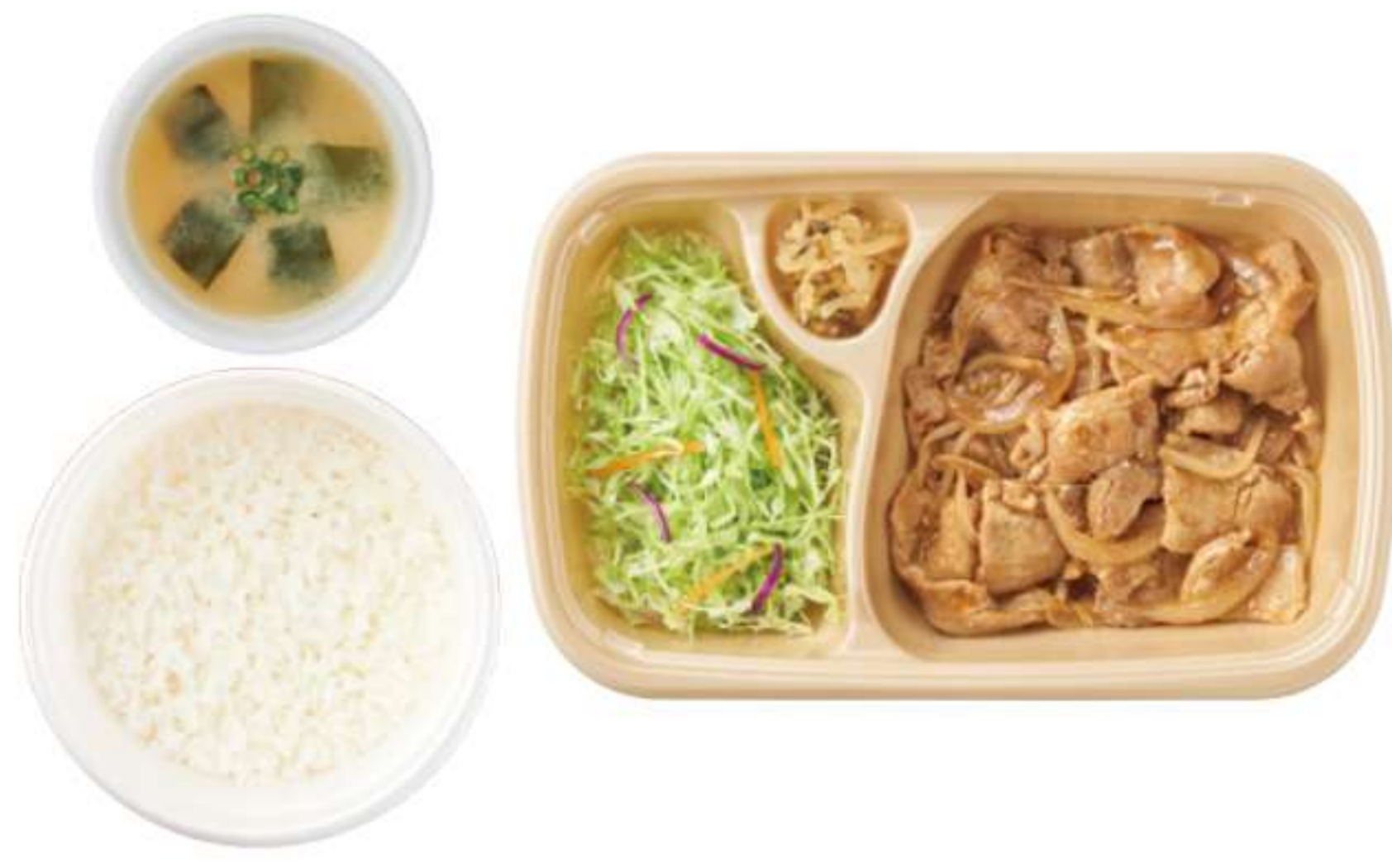
姜汁烤肉 带米饭、酱汤 ¥ 730