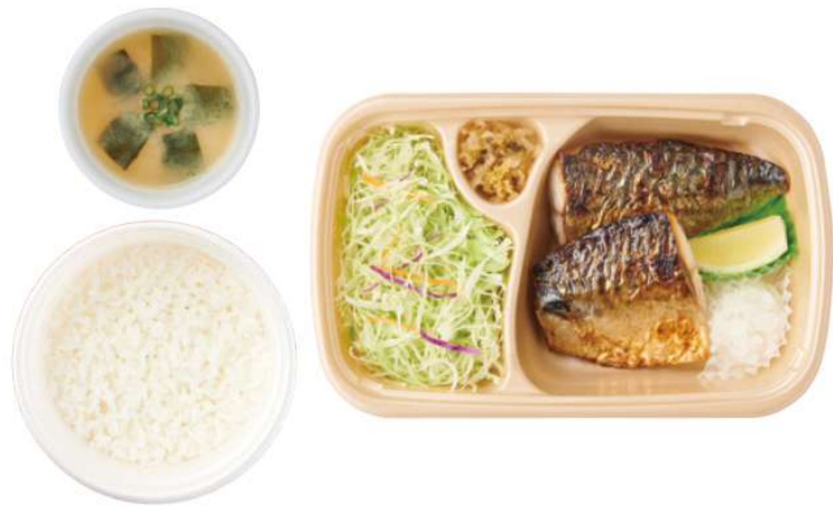
咸烤青花鱼 带米饭、酱汤 ¥ 770