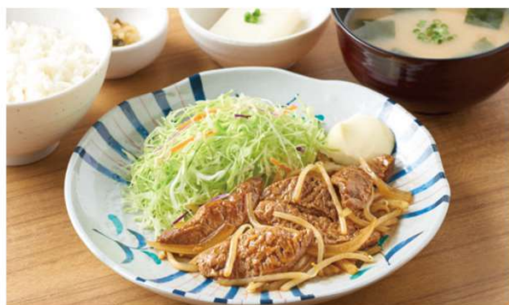
姜汁烤大豆肉套餐