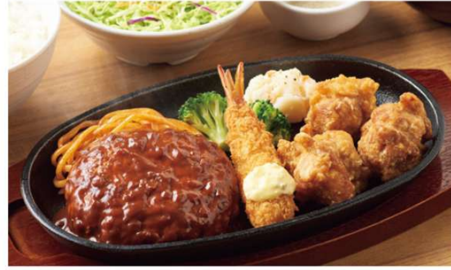
汉堡肉饼、油炸虾和炸鸡块 人气3组合套餐