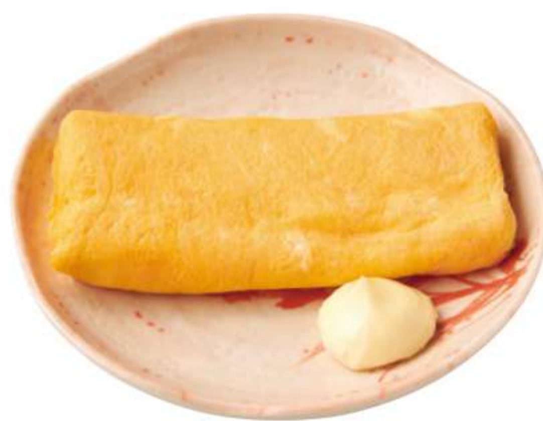
煎鸡蛋 ¥ 220