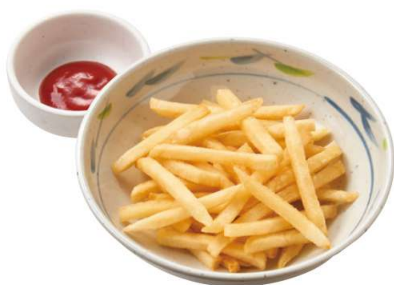
大盤炸薯条 ¥ 220