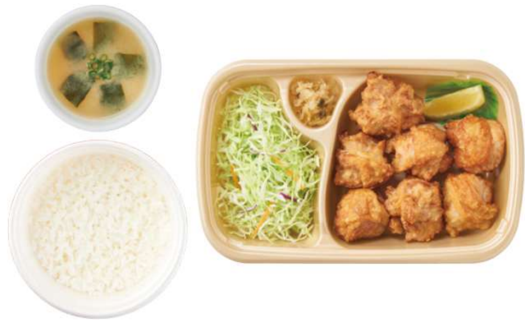
特大份炸鸡块 带米饭、酱汤 ¥ 960