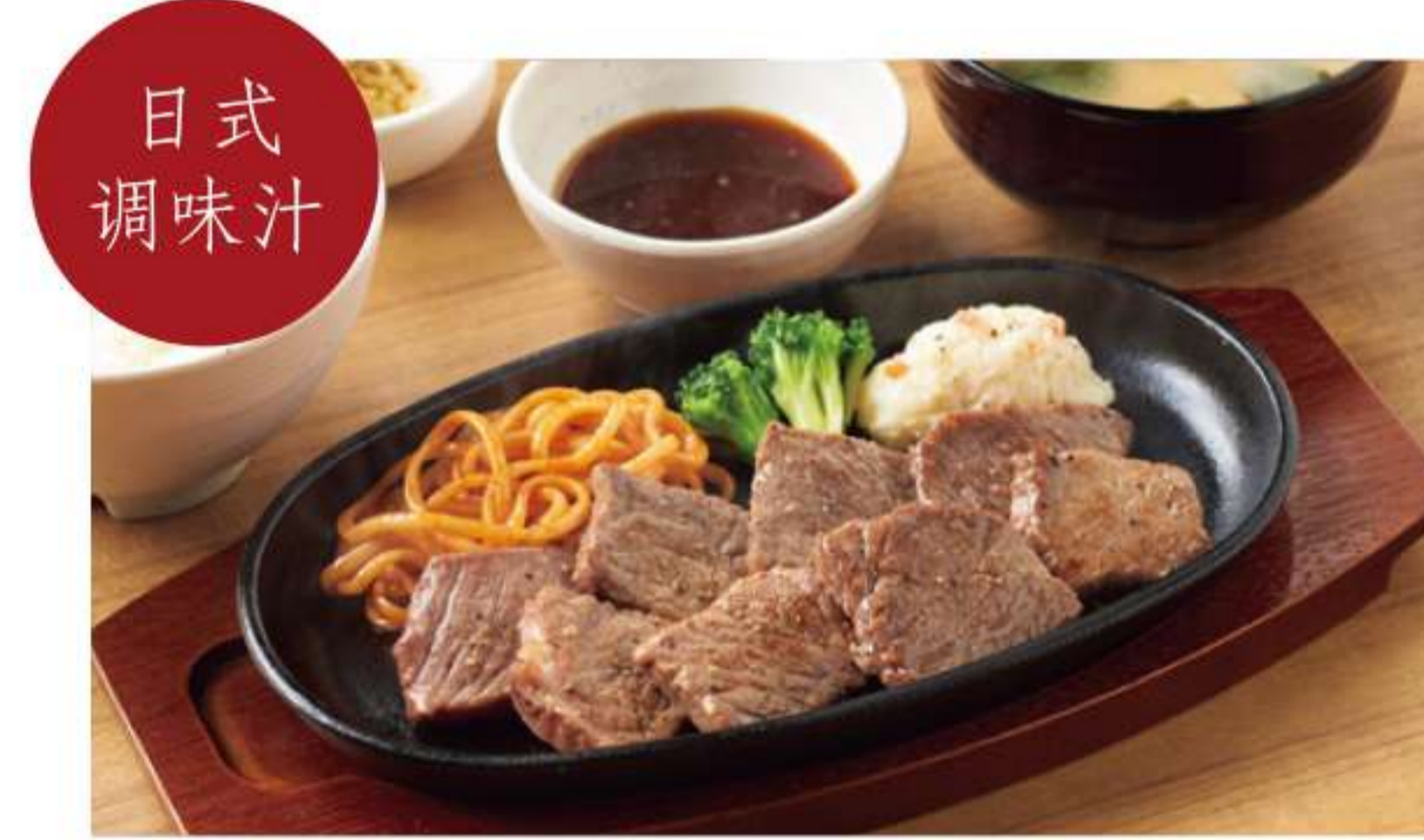
黑安格斯牛切块牛排套餐