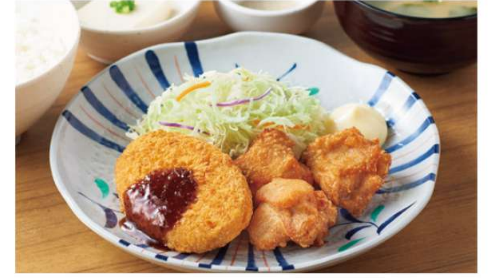
炸鸡块和可乐饼套餐