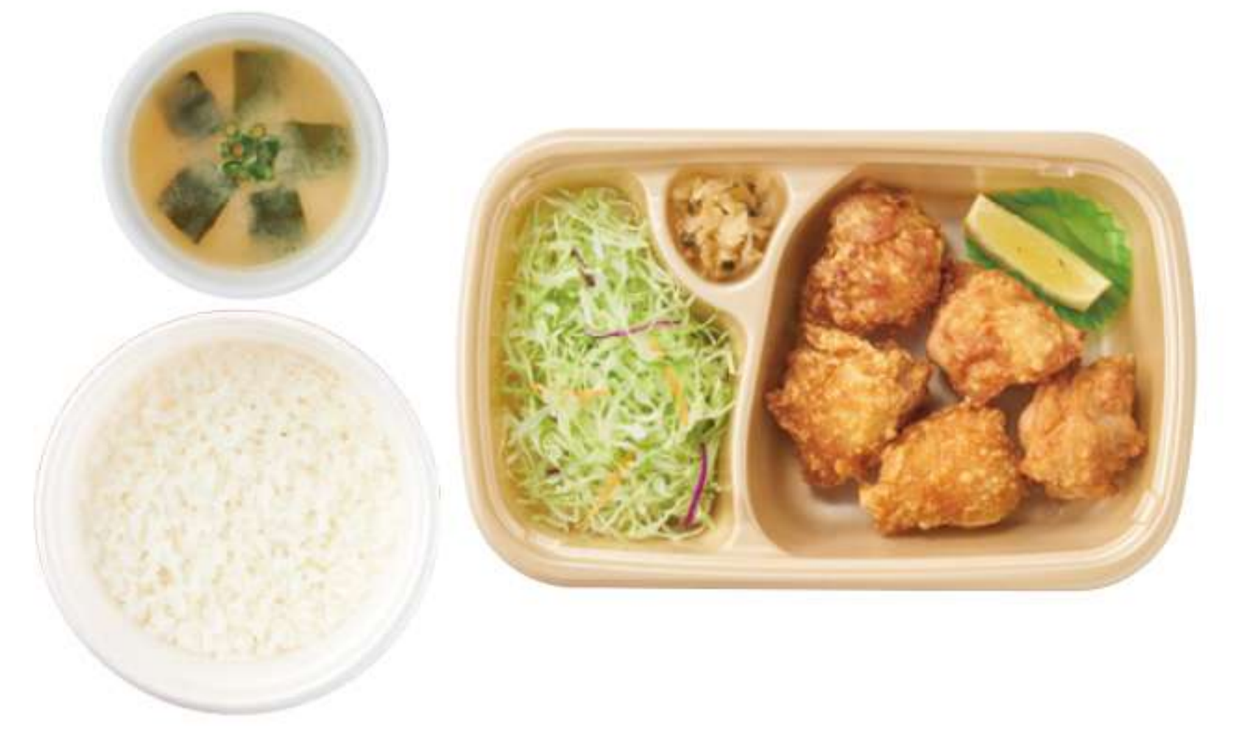
炸鸡块 带米饭、酱汤 ¥ 790