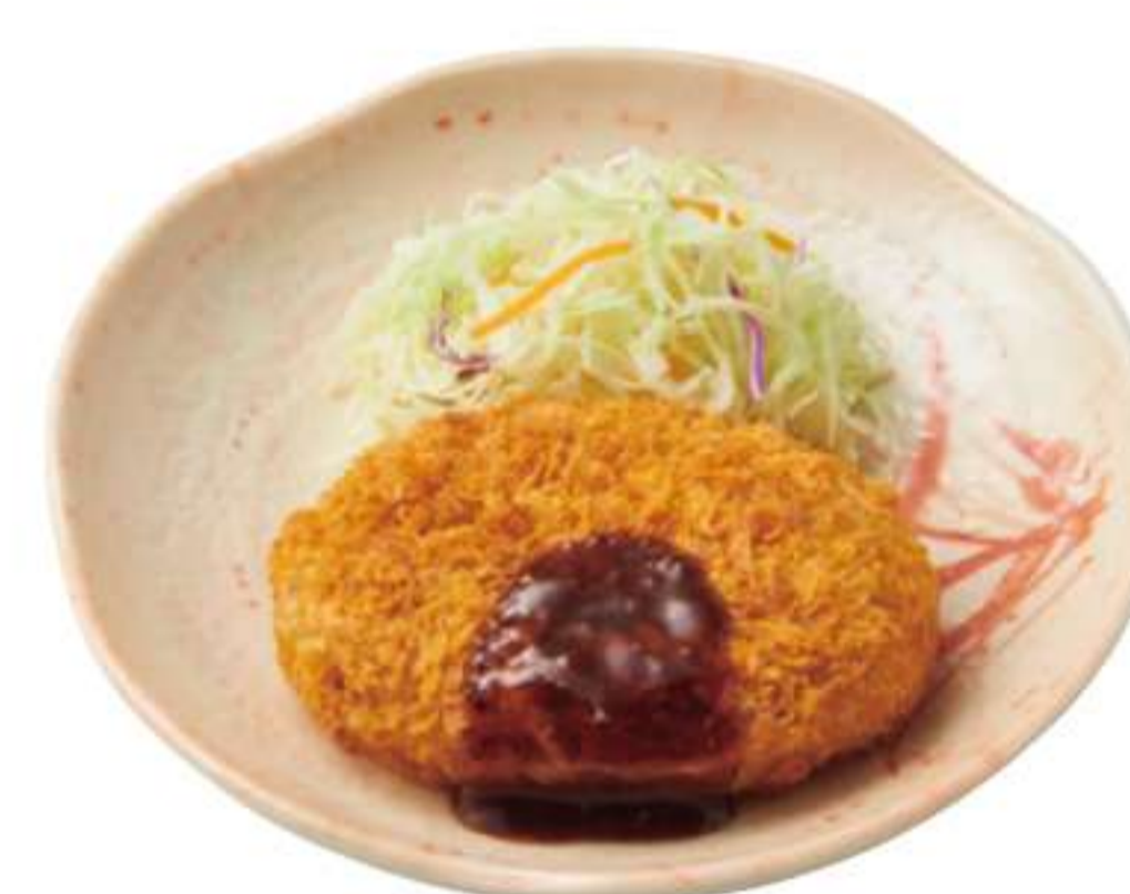
可乐饼(单点) ¥ 150