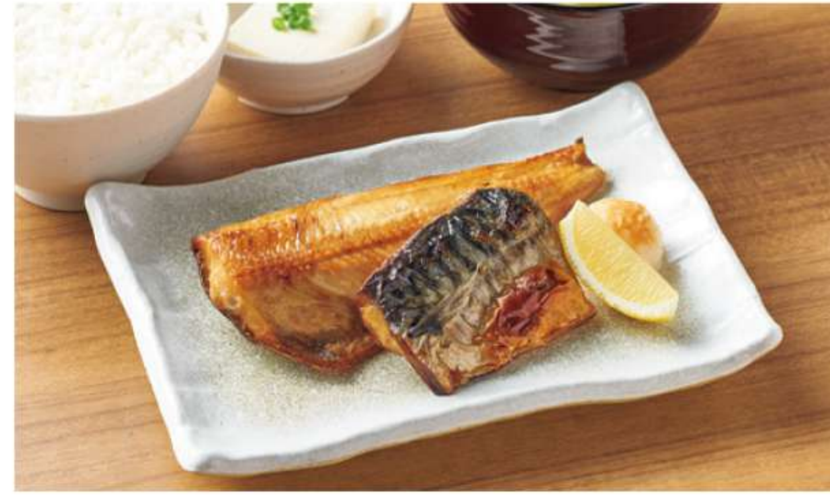
多线鱼和咸烤青花鱼套餐