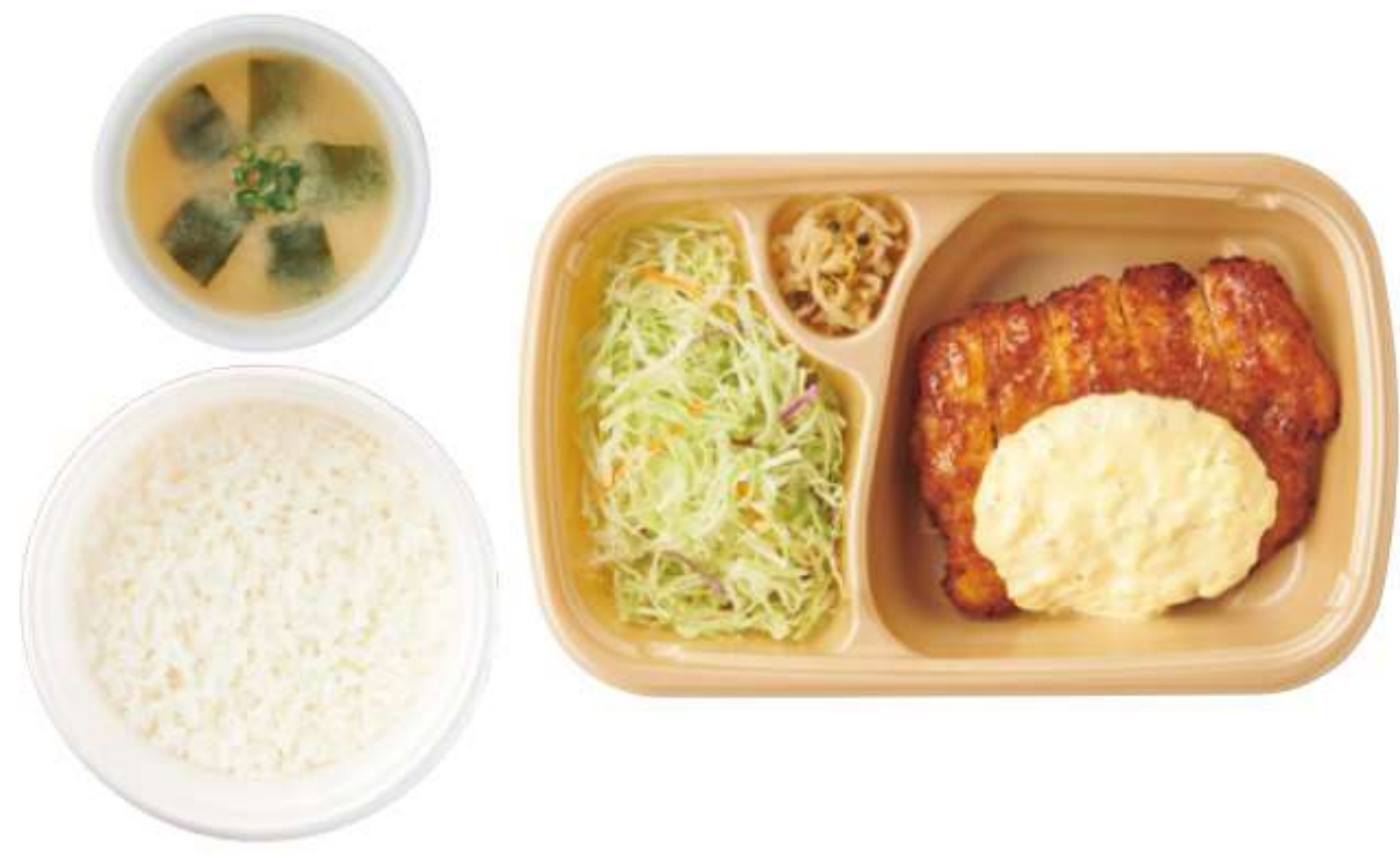
炸鸡排 带米饭、酱汤 ¥ 910