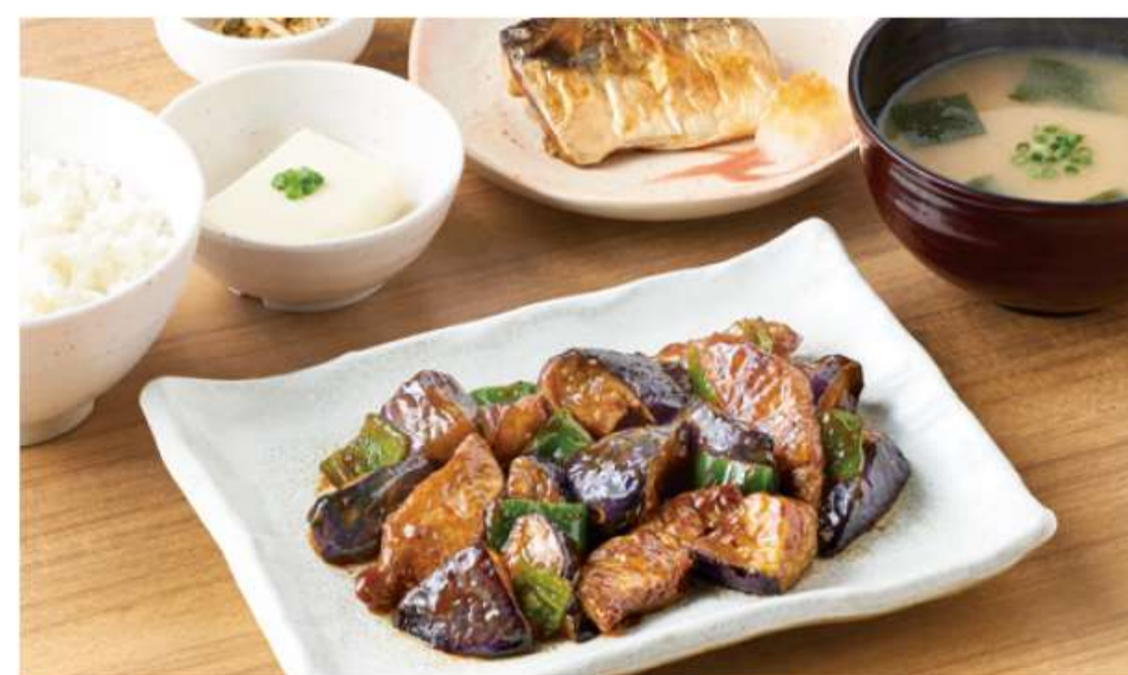
茄子大豆肉酱和烤鱼肉套餐