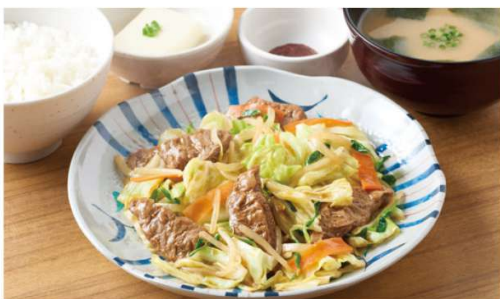
蔬菜炒大豆肉套餐