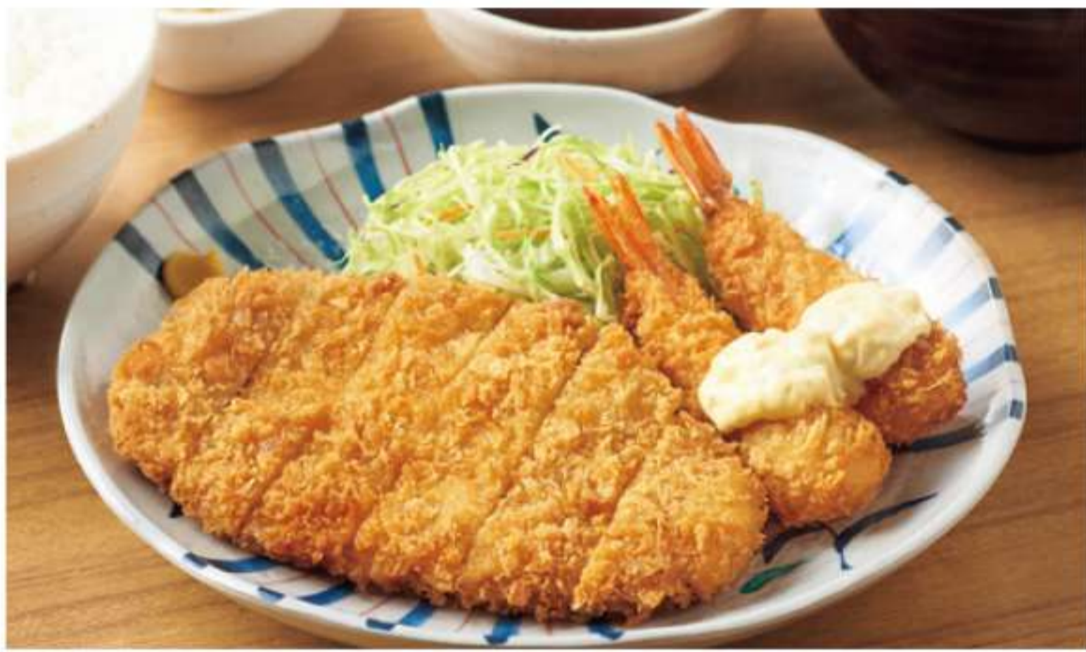
炸猪排和油炸虾套餐