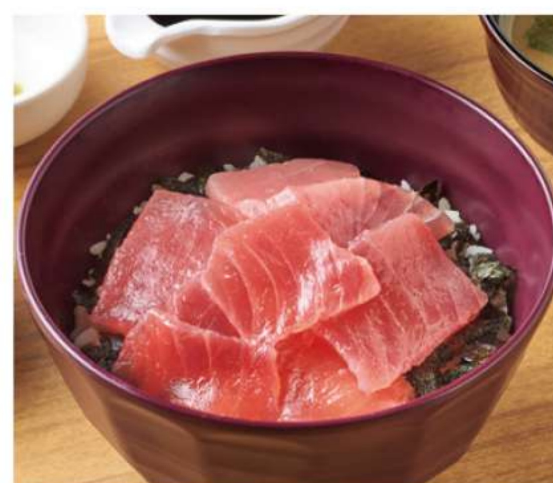
生金枪鱼片盖饭(带酱汤)