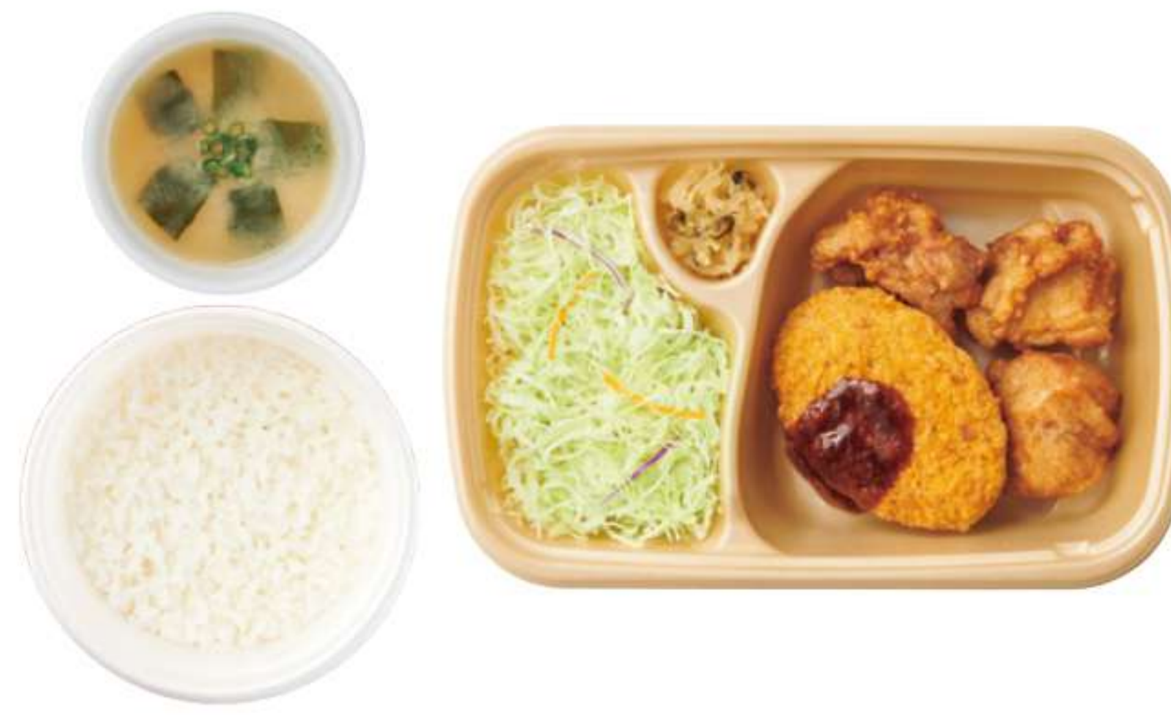
炸鸡块和可乐饼 带米饭、酱汤 ¥ 790