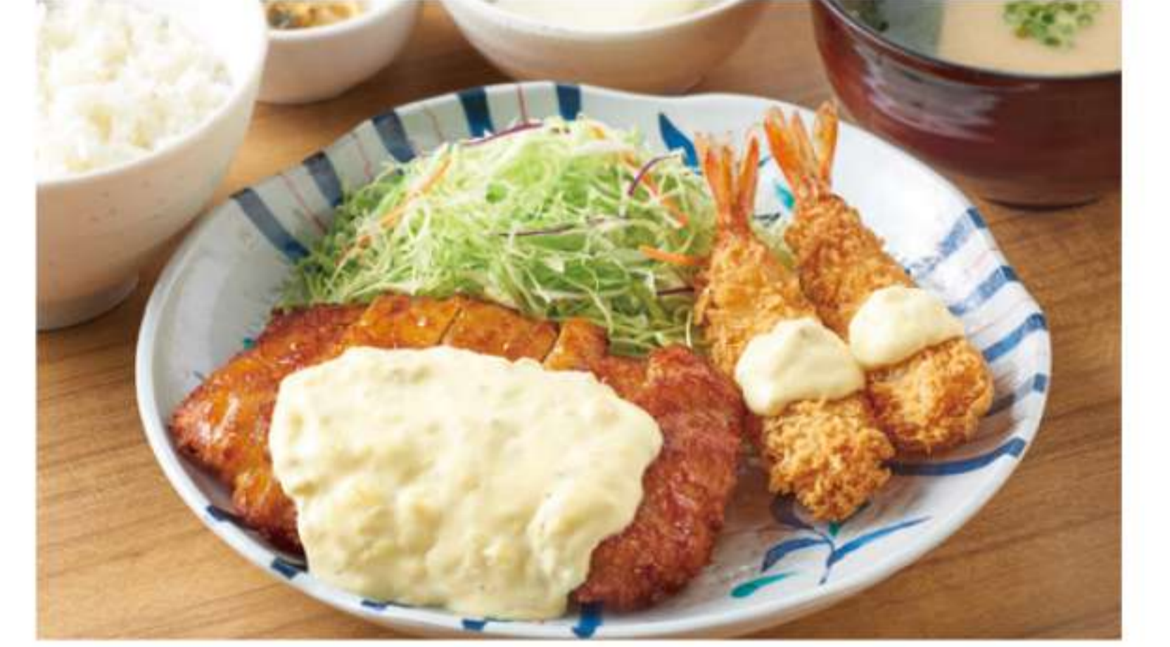
炸鸡排和油炸虾套餐