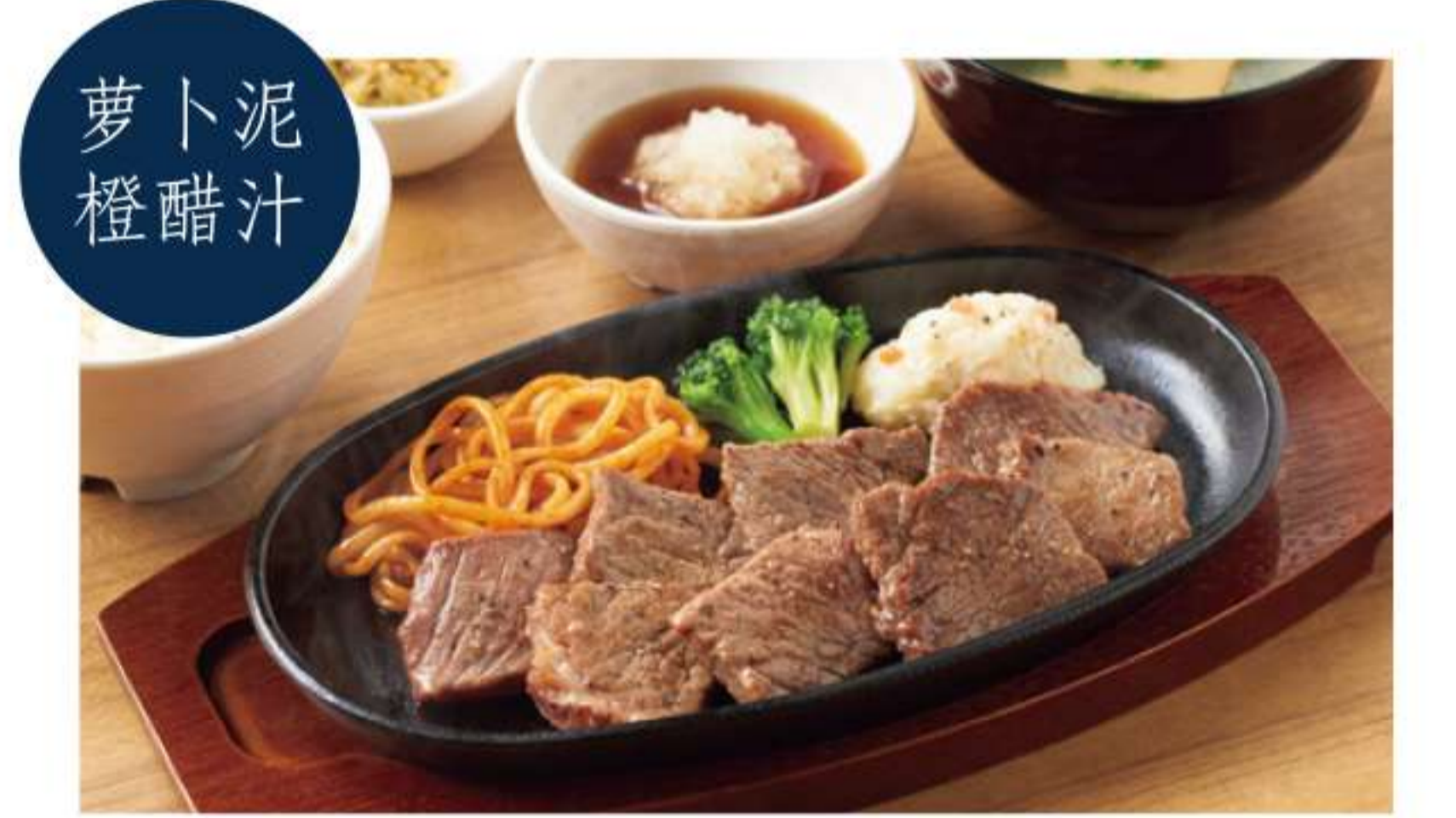
黑安格斯牛切块牛排套餐