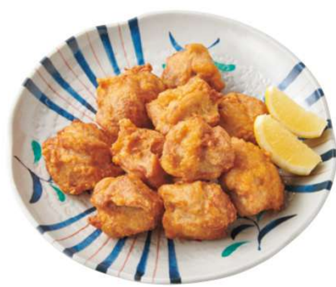
炸鸡块(10块) ¥ 910