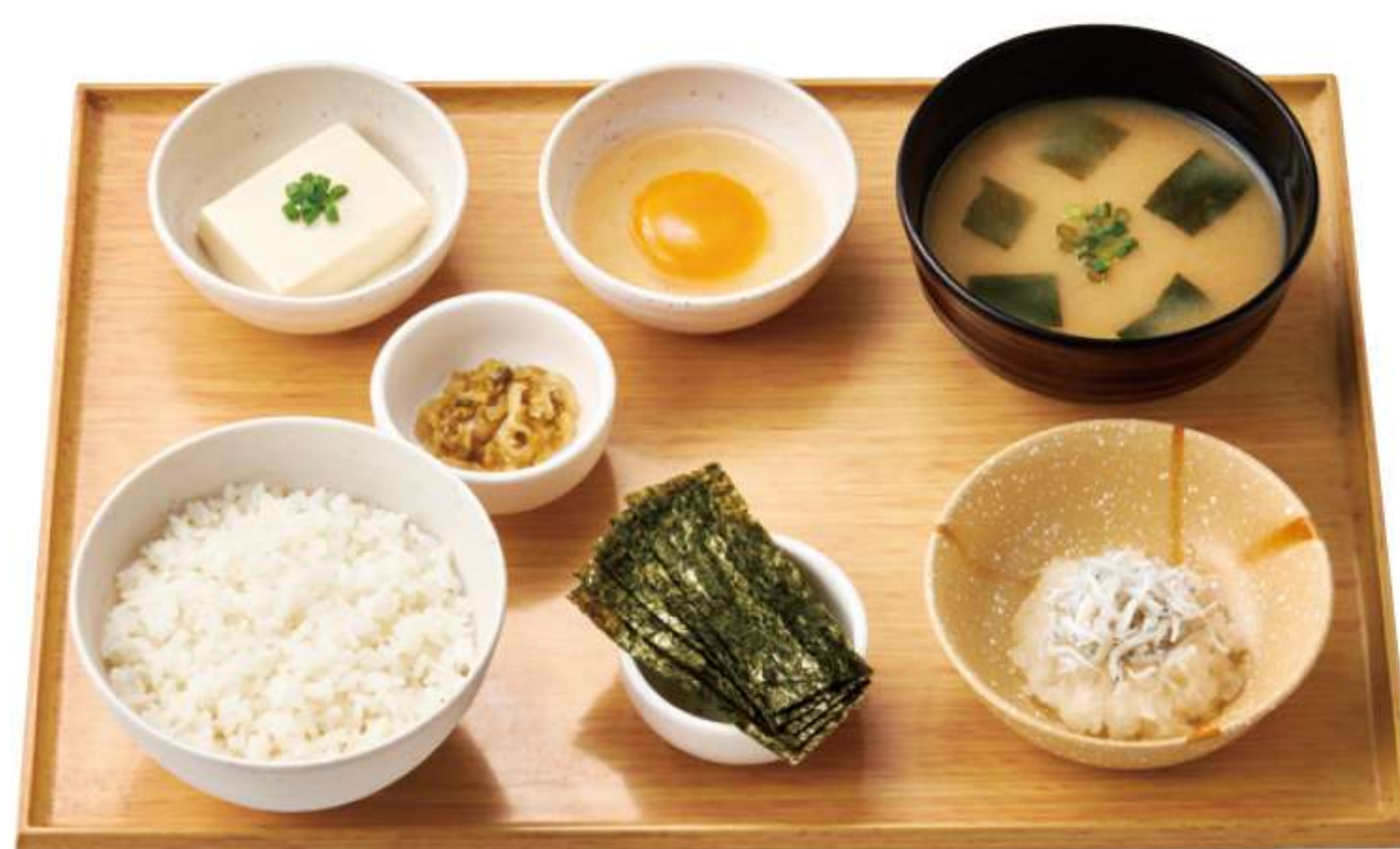
小白鱼萝卜泥早餐

※24小时营业店铺的早餐销售时间为上午5点到上午11点。其他店铺的营业时间，请向各店铺咨询。