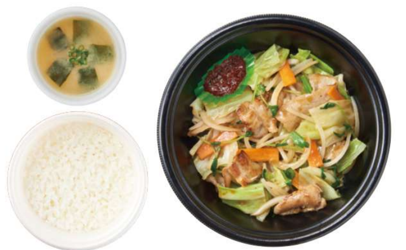
猪肉炒蔬菜 带米饭、酱汤 ¥ 820