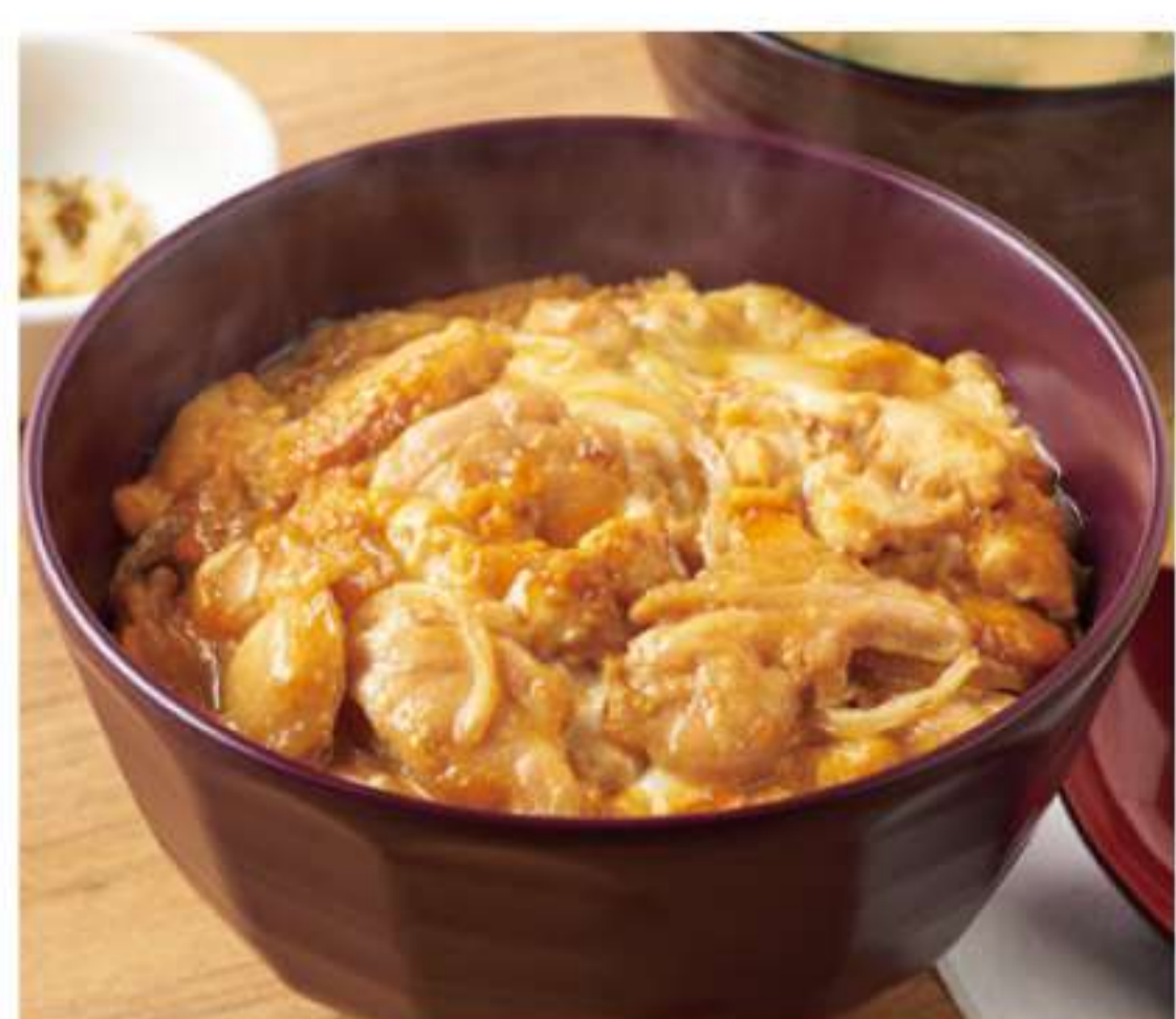
阿波尾鸡亲子盖饭(带酱汤)