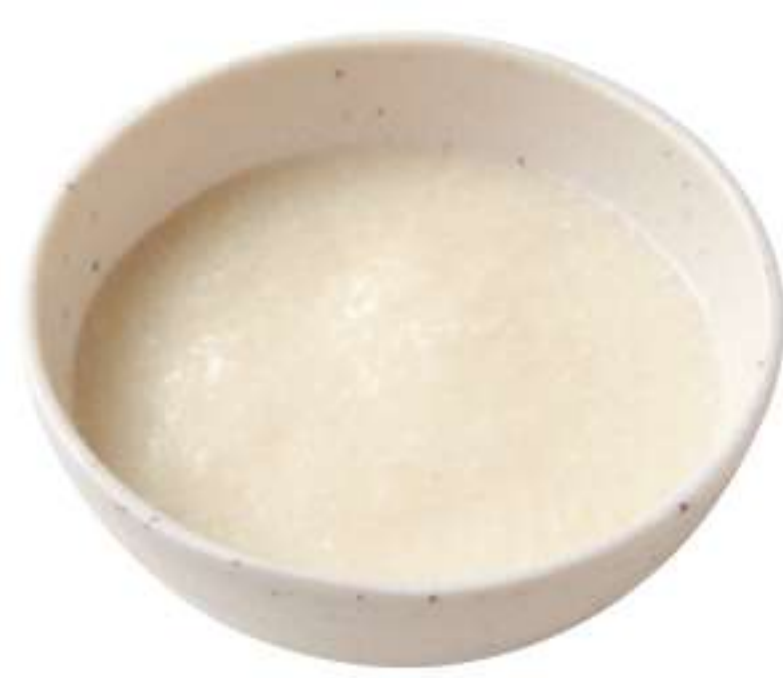
山药泥 ¥ 170